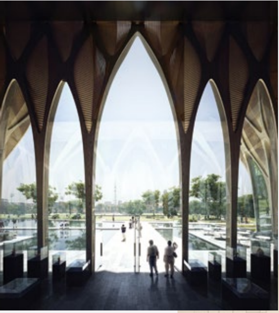
រូបខាងលើ៖ វិទ្យាស្ថានស្ទើរតែ (រចនាដោយស្ថាបត្យករលំដាប់ពិភពលោក លោកស្រី ហ្សាហា ហាឌីដ ឆ្នាំ២០១៤)

ស្ទើរតែគ្រប់សាលាធំៗទាំងអស់ សុទ្ធសឹងតែមានក្រិត្យក្រុមជាមូលដ្ឋាននៃជំនឿនិងរឿងព្រេង ស្តីអំពីវត្តមាននិងតួនាទីនៃឋានសួគ៌និងឋាននរក។ គ្មានសាលាណាមួយដែលបកស្រាយអំពីរឿងព្រេងនិទាននិងទំនាក់ទំនងរបស់ព្រះទេវតា នៅឋានសួគ៌ និងយាមនៅឋាននរក បានសព្វផ្សាយដោយនិងស្តើជម្រៅជាងព្រះពុទ្ធសាសនានិងសាលាហិណ្ឌូនៅក្នុងទ្វីបអាស៊ី ដែលជាសាលាបង្ហាញរបស់ប្រទេសកម្ពុជានោះទេ។ ភាពសម្បូរបែបនៃទំនៀមទម្លាប់ប្រពៃណីសាលាទាំងពីរ គឺមិនអាចមាននៅលើតួអង្គល្អនិងតួអង្គអាក្រក់របស់លោកខាងលិច ឬសាលានៅដែលកើតក្រោយដទៃទៀតដូចជាសាលាដើម្បី, គ្រិស្តសាលា និងសាលាឥស្លាមនោះឡើយ។ យោងតាមព្រេងនិទានរបស់ព្រះពុទ្ធសាសនានិងសាលាហិណ្ឌូ ឋាននរកនិងឋានសួគ៌មានសារៈសំខាន់ក្រៃលែង ក្នុងការទទួលបានស្ថាប័ននិងការយល់ដឹងថា តើ មូលហេតុអ្វីបានជាប្រជាជនកម្ពុជាមានប្រតិកម្មចំពោះកេរដំណែលដ៏អសោចនៃរបបខ្មែរក្រហម ខុសពីការយល់ឃើញរបស់លោកខាងលិចដែលពោរពេញទៅដោយការចងកំហឹង ការដាក់ទោសទណ្ឌនិងការបង់អាយាត។